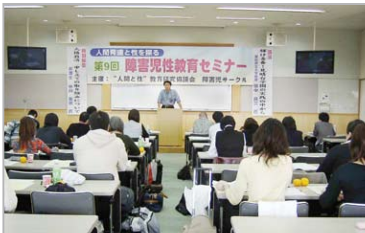
<1日目の全体会にて>

閉会全体会で各分科会の雰囲気と成果を確認しあった2日目。性教育を子どもが学ぶ権利を保障するという視点か