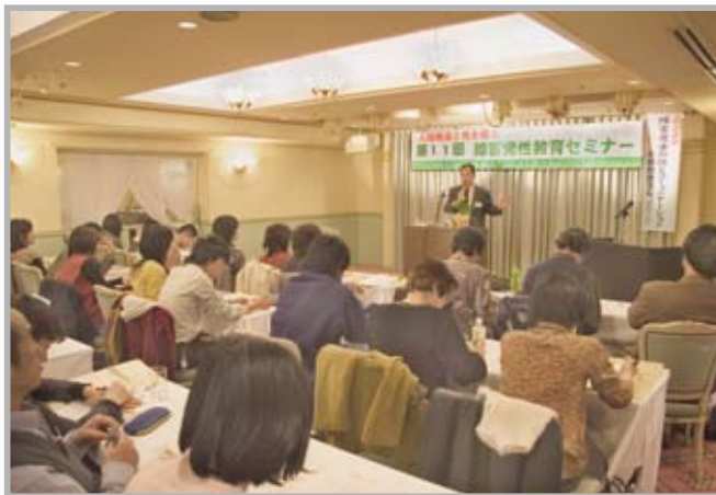
<第11回障害児性教育セミナー>

れた「自慰プロジェクト」の研究を2年間かけて今回「障害のある人たちの自慰行為の実態とその支援に関する実証的・実践的研究」として冊子にまとめました。(頒価500円)